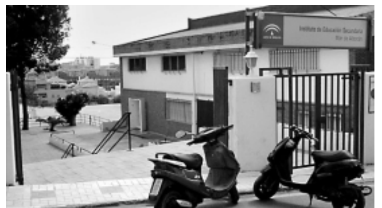
MAR DE ALBORÁN. Imagen de un instituto de Estepona.

ses. El sistema, cuyo coste de instalación se desconoce por ahora, controlará todo el perímetro de los colegios e institutos y estará conectado directamente con la Jefatura de la Policía Local para actuar de inmediato si se detecta alguna incidencia.