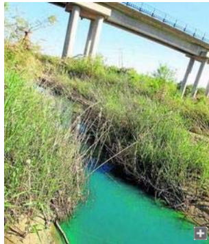
Vertido de color azul aparecido en el cauce del río Guadalhorce, cerca de la desembocadura.

La aparición del vertido de un líquido de color azul intenso en el cauce del río Guadalhorce, cerca de la desembocadura, ha llevado a la Guardia Civil, la Delegación provincial de Medio Ambiente y la Empresa Municipal de agua de Málaga (Emasa) a abrir una investigación para tratar de aclarar un hecho que no es la primera vez que sucede. Fue hace dos años cuando la Policía Local denunció por primera vez el vertido procedente de las instalaciones que Renfe tiene en la zona de Los Prados para el mantenimiento de sus trenes y que fue localizado en el cauce público.