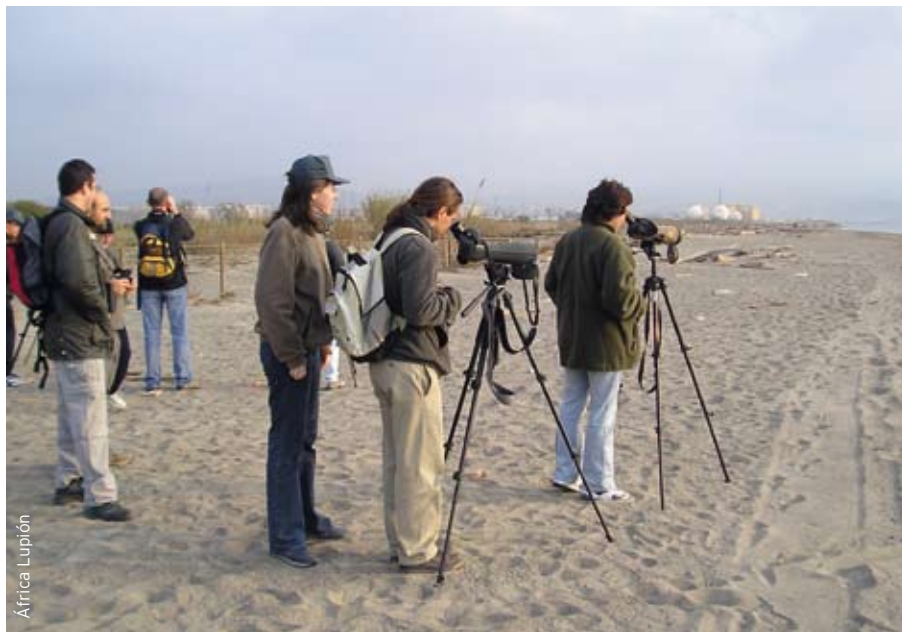
Voluntarios durante una jornada de formación para participar en el censo del chorlitejo patinegro.

El chorlitejo patinegro es un ave limícola que utiliza como hábitat de cría y reproducción las playas arenosas y las áreas salobres del interior. El Libro Rojo de las Aves de España la incluye como "vulnerable" para el territorio nacional, mientras que en el Libro Rojo de los Vertebrados Amenazados de Andalucía figura como "en peligro de extinción". Dado el interés de la conservación de esta especie y los escasos datos de la población malagueña, el grupo local SEO-Málaga decidió realizar en la primavera de 2007 un censo de la misma.