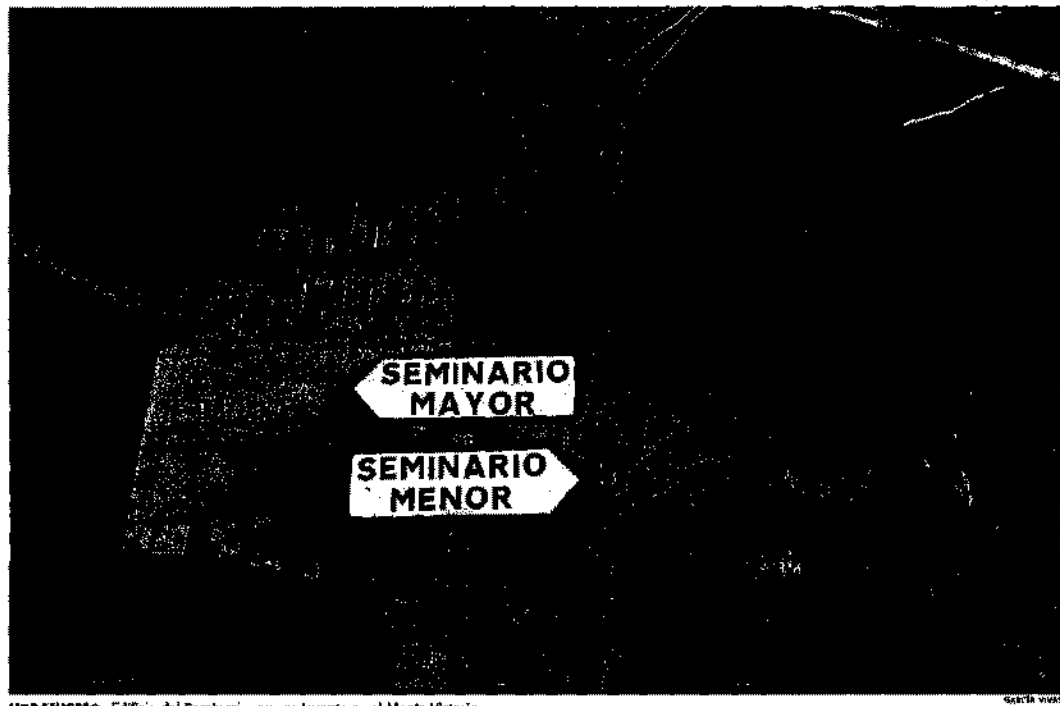
URBANISMO. Edificio del Seminario, que se levanta en el Monte Victoria.

El hecho de que el avance no recoja la propuesta, ha hecho que